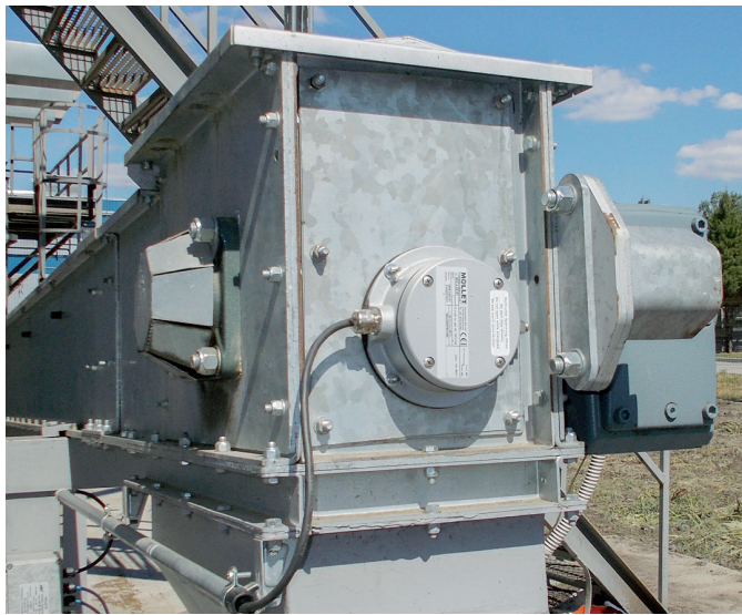
Abb. 3: MFE im Einsatz als Materialstauemelder in einem Trogkettenförderer

Sobald es einen Materialrückstau gibt, wird die Schnecke gestoppt und ein Störsignal ausgegeben. Dieses Signal kann erst zurückgesetzt werden, wenn ein Monteur die Ursache für den Rückstau ermittelt hat und den Membranschalter manuell mit der Rückstelltaste betätigt. Dies wurde durch den Einbau eines speziellen Schalters mit zwei stabilen Positionen ermöglicht.