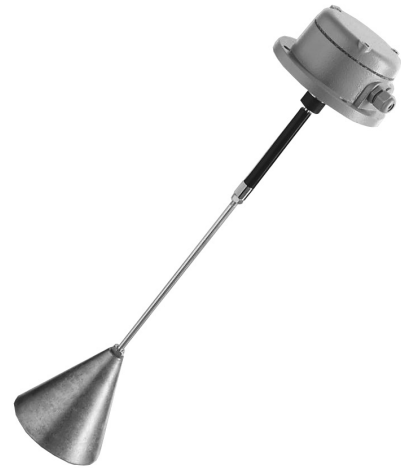
Abb. 5: Der „MOLOSpendu“ ermöglicht die stromlose Füllstandmessung in Schüttgütern.

Die Messgeräte dieser Serie sind mit ATEX-Zertifikaten für den Einsatz in staub- und gasexplosionsgefährdeten Bereichen erhältlich. Unterschiedliche Ausführungsvarianten ermöglichen eine optimale Anpassung an den jeweiligen Einsatzbereich.