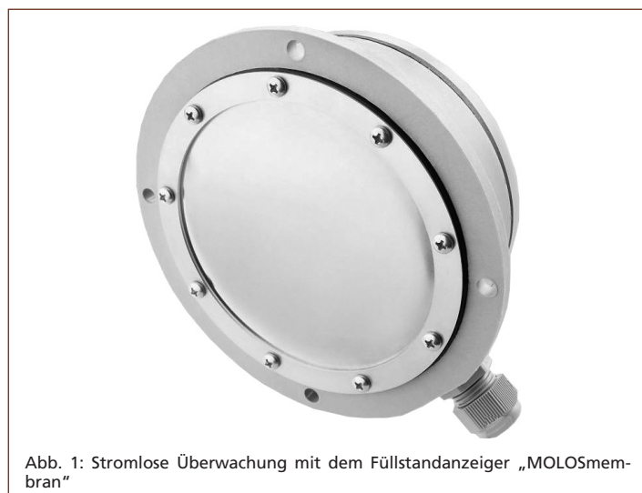
Abb. 1: Stromlose Überwachung mit dem Füllstandanzeiger „MOLOSmembran“

Alle produktberührenden Teile, wie Haltering und Membrane, sind aus Edelstahl erhältlich. Sofern dies nicht erforderlich ist, können auch Varianten aus preiswerteren Materialien (z. B. Viton-Membranen oder Halterringe aus verzinktem Stahl) be-